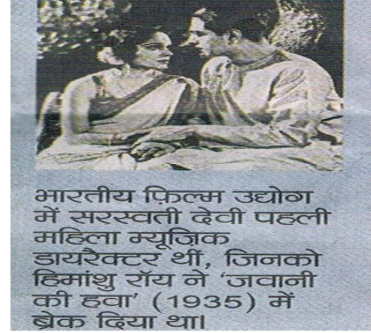
भारतीय फिल्म उद्योग में सरस्वती देवी पहली महिला म्यूजिक डायरेक्टर थीं, जिनको हिमांशु रॉय ने 'जवानी की हवा' (1935) में ब्रेक दिया था।